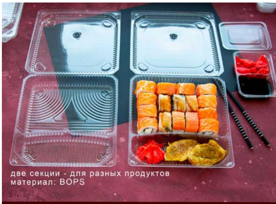
две секции - для разных продуктов материал: BOPS