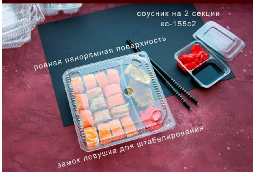
соусник на 2 секции кс-155с2